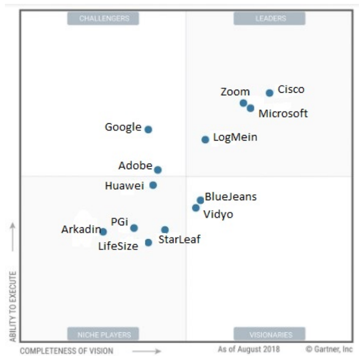
Рис.1 – «Магічний квадрант» Gartner для систем відео-конференцій зв’язку [2]

Зі свого боку дослідницька компанія IDC в липневому дослідженні 2019 року лідерами ринку ВКЗ назвала Cisco і Microsoft (рис.2). Великими гравцями ринку названі Google, Zoom, BlueJeans, Vidyo, Avaya, Lifesize, Huawei і Polycom.