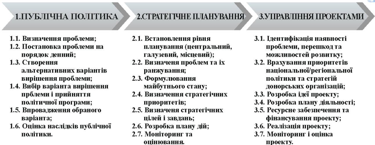
Рис. 1. Взаємозв'язок між публічною політикою, стратегічним плануванням та управлінням проектами