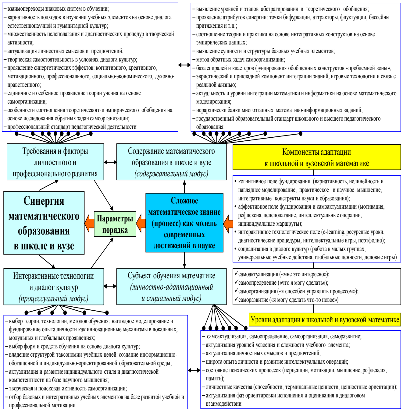
Рис.1. Структурно-функциональная модель проявления синергии математического образования в школе и вузе

(«я способен управлять процессом»), саморазвития («я могу сделать что-то новое»). Важнейшим компонентом адаптационных процессов является самоуправление малых творческих групп на основе умения адаптироваться и развиваться в социальных коммуникациях на основе принципов самоуправления, распределения ролей, осознания личных смыслов и предпочтений, создания творческих групп; формирование положительной «Я-позиции» в условиях диалога культур и творческой самостоятельности. Переживание ситуации успеха, социальное одобрение также является немаловажным фактором успешности адаптационных процессов и личностного развития в социуме. При этом синергия математического образования